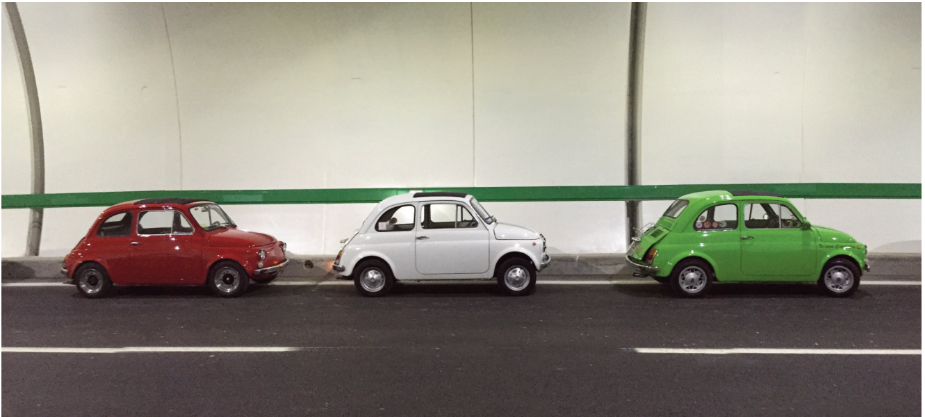
Le tre cinquecento storiche che hanno percorso per prime la Variante