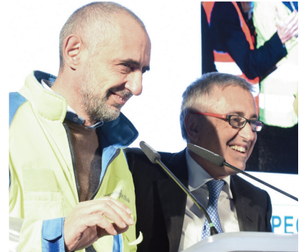
Alcuni momenti dell'inaugurazione