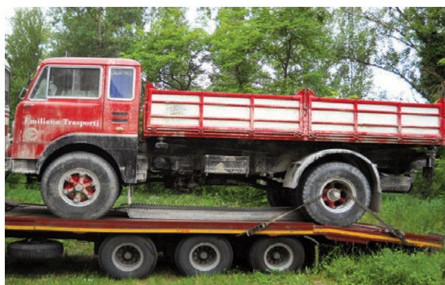
Rioveggio (Bologna) - Veicoli d'epoca sul set della fiction. A sinistra, il pullman OM utilizzato per trasportare gli operai in cantiere. A destra, l'autocarro FIAT 682 N2 appositamente sporcato di sabbia per rendere più realistica la scena di cantiere.