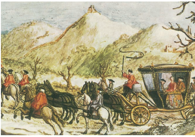
In carrozza sulla Futa. Da notare sullo sfondo il Santuario bolognese della Madonna di San Luca