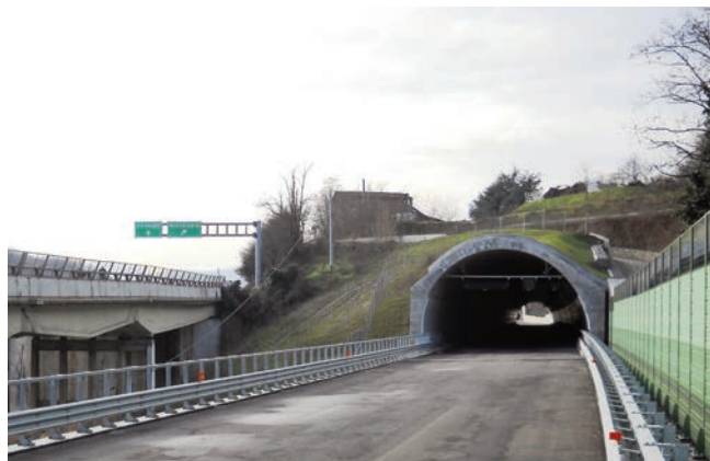
Galleria La Quercia [300 metri]