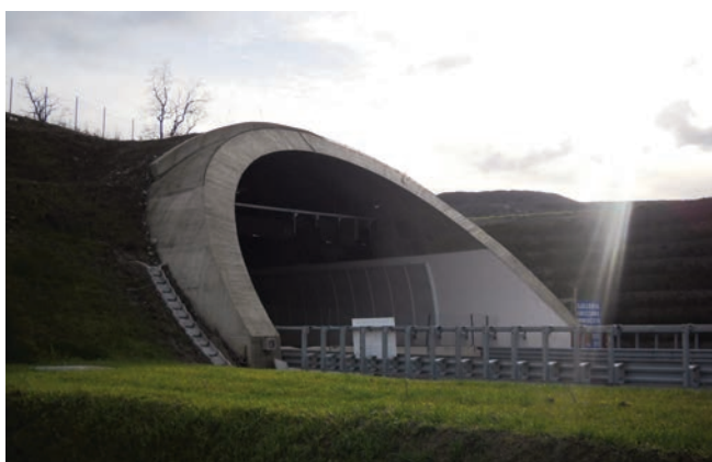
Galleria Grizzana [2.200 metri]