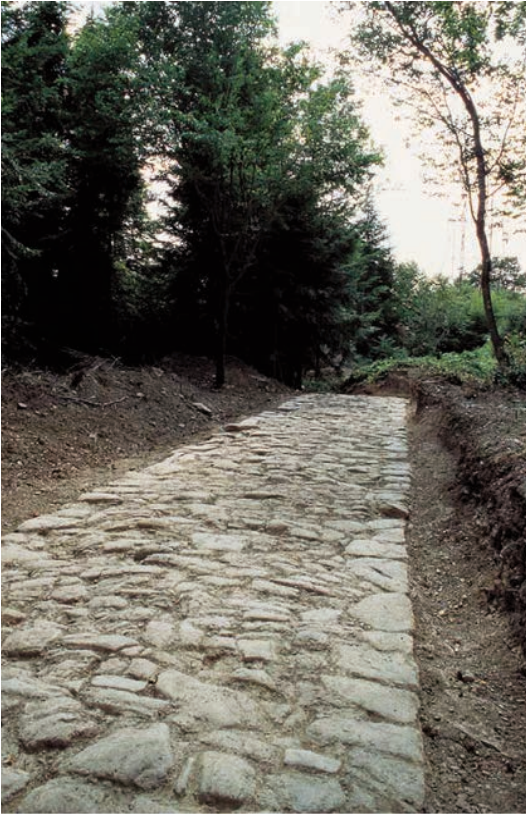
La strada romana

Non è semplice sintetizzare la lunghissima storia dei collegamenti viabili tra Bologna e Firenze. Anche perché ogni epoca ha avuto il problema di come superare la catena appenninica per viaggiare tra NORD e SUD della penisola. Pellegrini in viaggio verso Roma, mercanti, soldati, funzionari dei vari Stati presenti prima dell'unificazione.