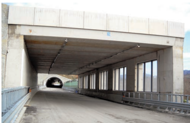
Galleria Rioveggio II [80 metri]