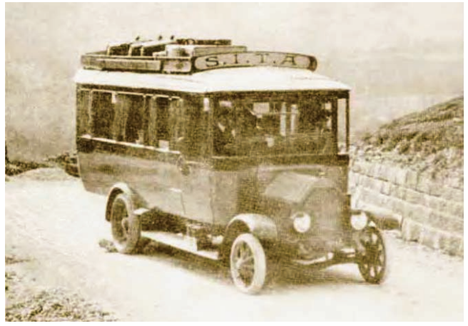
Corriera in transito sulla Futa

rivalità di confine tra i feudi della montagna. Una parentesi. Verso la metà del settecento la strada della Futa, per volontà del Granduca di Toscana Francesco I di Lorena, venne allargata e resa praticabile alle carrozze, mentre le altre strade di valico restarono percorribili solo a piedi o a dorso di mulo.