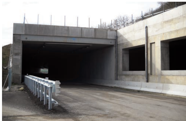
Galleria Casino [117 metri]