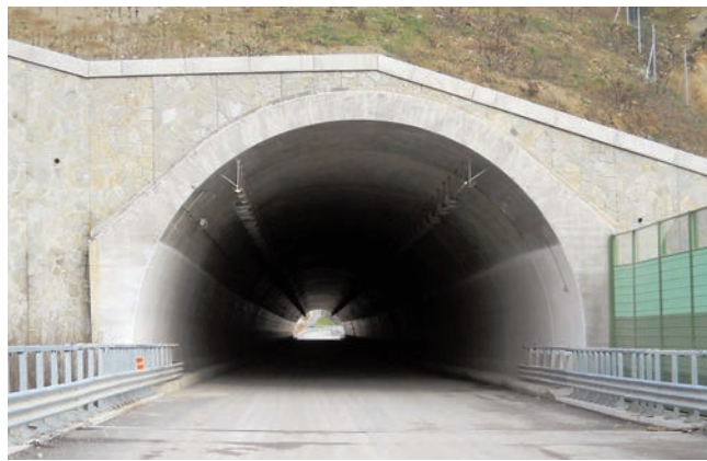
Galleria Rioveggio I [340 metri]