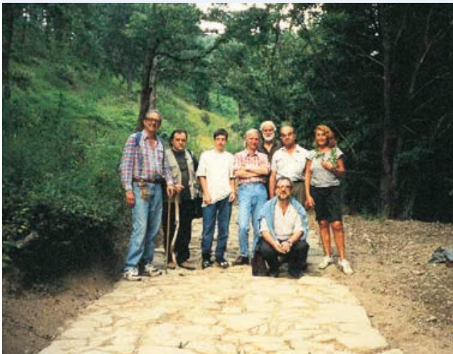
In posa sulla strada romana (dal libro "La strada Bologna-Fiesole" - CLUEB editore)

Ulteriori notizie su questa scoperta sono disponibili sul sito: www.flaminiamilitare.it .