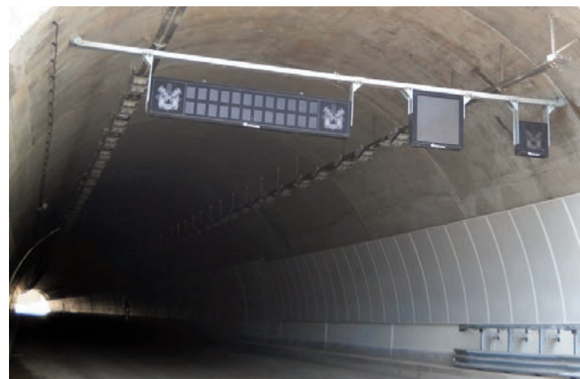
Pannelli a Messaggio Variabile

femminile nel campo delle costruzioni. C'è già stato qualche segnale positivo in questa direzione?