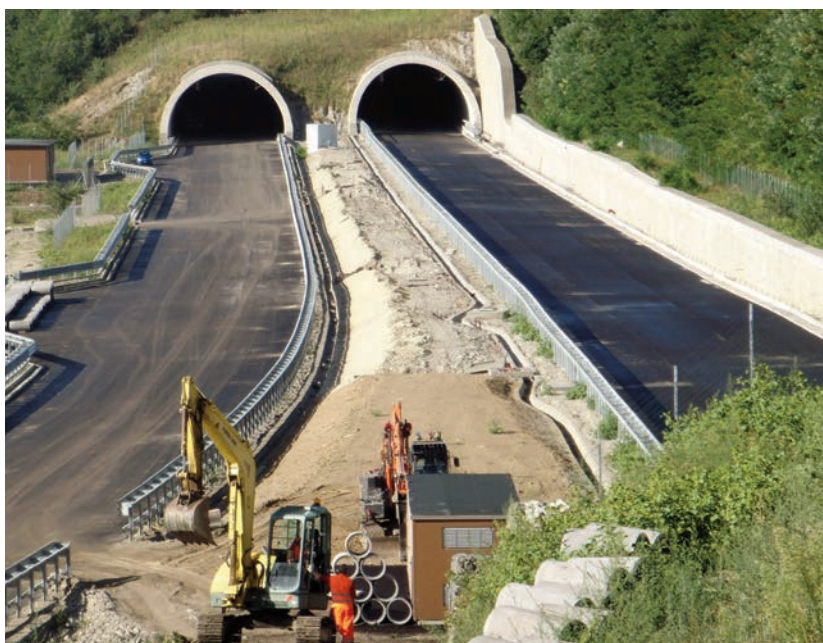
Fine lavori sul lotto 5A: l'ultimo escavatore se ne va...

All'ingresso di quelle più lunghe sono già stati montati dei pannelli a messaggio variabile che entreranno in funzione quando la Variante di Valico sarà aperta al traffico e serviranno per informare gli utenti circa eventuali pericoli o disagi all'interno dei tunnel. I viadotti sono (da nord a sud): Viadotto Quercia, lunghezza 352 metri, Viadotto Casino, lunghezza 117 metri, Viadotto Rioveglio, lunghezza 330 e Viadotto Pian di Setta che, con una lunghezza di 633 metri, conduce all'imbocco della Galleria Grizzana portando il tracciato dal versante sinistro al versante destro del torrente Setta.