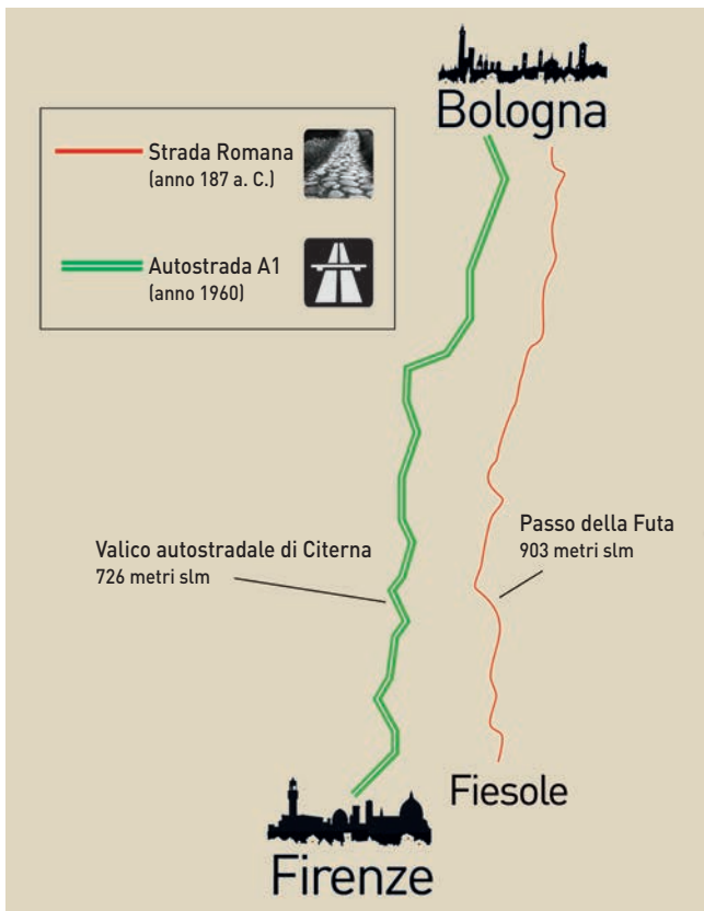
La strada romana e l'Autostrada del Sole

Sappiamo infatti che i pellegrini diretti a Roma per partecipare al primo Anno Santo della storia indetto nel 1300 transitarono da Firenzuola e dal Passo del Giogo e non dalla Futa e questo a causa delle