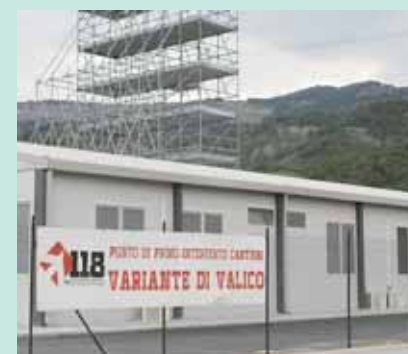
Il punto di primo intervento 118

Prosegue con un nuovo accordo la collaborazione tra Azienda USI di Bologna e Autostrade per l'Italia per assicurare l'assistenza sanitaria nei territori coinvolti nei lavori per la realizzazione della Variante di Valico. Per garantire l'assistenza sanitaria dei lavoratori nei cantieri, degli utenti sul percorso autostradale e dei cittadini residenti, Autostrade ha impegnato cinque milioni di euro , che si aggiungono al contributo finanziario nel corso degli ultimi 5 anni, per una cifra complessiva di 12,5 milioni di euro . Dall'inizio dei lavori fino al 31 agosto 2007, è stata