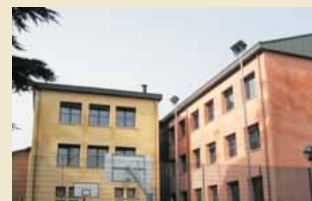
La nuova scuola elementare di Vado

Nell'ambito del progetto Variante di Valico sono stati previsti, da parte di Autostrade per l'Italia, numerosi interventi a favore degli enti locali sui quali insistono i cantieri.