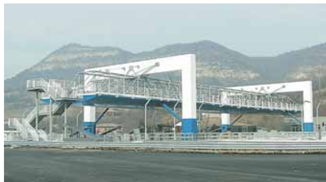
Il nuovo casello di Sasso Marconi, sul lotto 2

Nel contesto dei lavori sul LOTTO 1, l'ampliamento del corpo autostradale si trova già in un'avanzata fase di realizzazione , per raggiungere l'obiettivo di apertura del tratto al traffico entro giugno 2006.