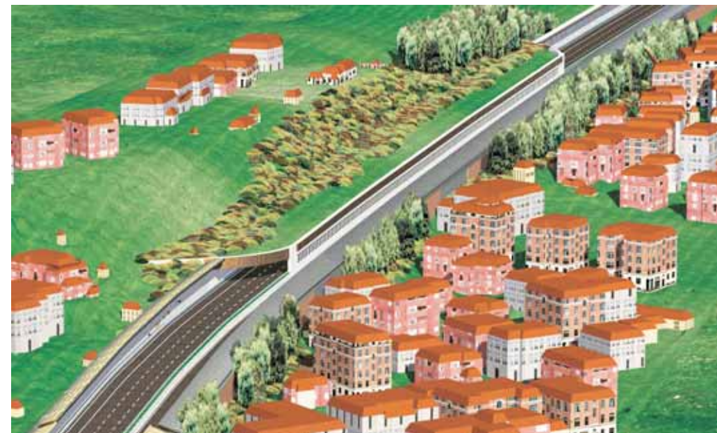
Proiezione grafica della galleria artificiale di Calzavecchio

Come di consueto, per l'attenzione a un territorio fortemente urbanizzato, lo studio di impatto ambientale ha previsto un monitoraggio continuo di rumore, vibrazioni e qualità dell'aria, a partire da un anno prima dell'inizio dei lavori.